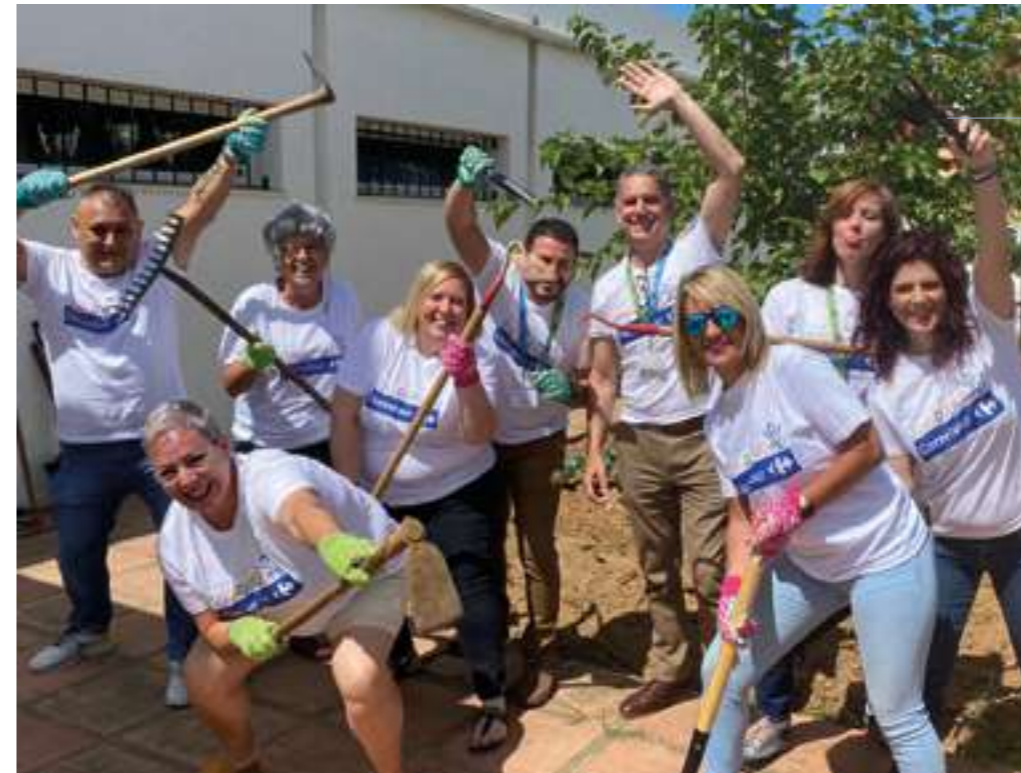
Desde estas líneas, el mayor de los HOMENAJES a los miles de colaboradores y colaboradoras de Carrefour España por su apoyo incondicional a nuestra labor social #JuntxsHacemosFundacion